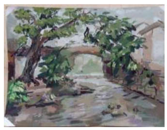
14 视传 苗琦