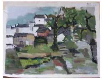
14 环艺 崔明伟