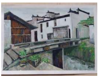
14 环艺 杜璇