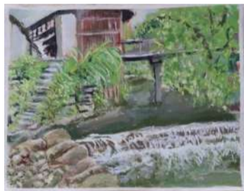
14 视传 李齐