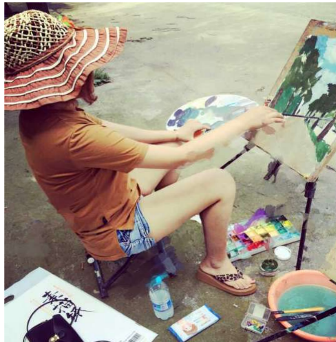
你看我是不是也有大师范儿?

在这十二天的写生日子里,我们都学到了很多,不仅画画技巧有所提高,对古代建筑以及南方水乡的风格也有了更进一步的了解,同学们都留下了一份难忘的回忆,快乐的日子总是短暂,美好的时光一闪而过,回到校园就像从梦境回到了现实,婺源,你美丽多娇,迷住了我的眼,留下了我的心。