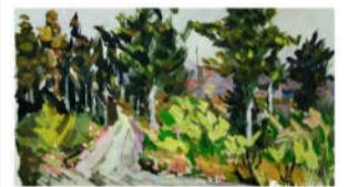
水粉画是使用水调合粉质颜料绘制而成的一种画。