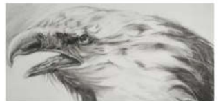
画素描是从我们看不见的东西开始,而以看见的东西结束。