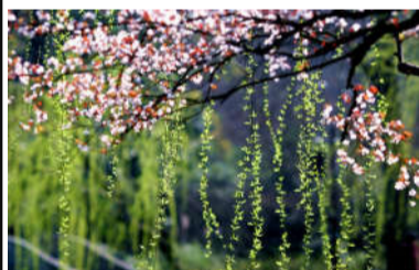
春水初生,春林初盛,春风十里不如你