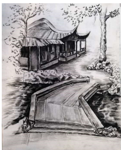
18 数媒一班 任保頔