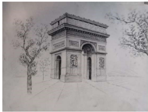
18 数媒一班 王一诺