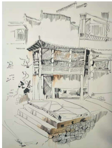
17 环艺二班 段荣斌