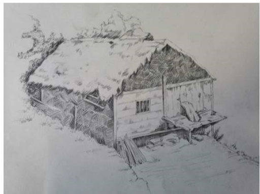
18 数媒一班 肖海慧