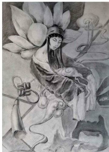
18 数媒二班 张心雨