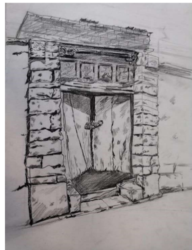
18 数媒一班 郑宗鉴