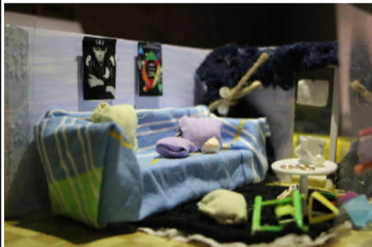
《阳光首院 三室两厅》王琳