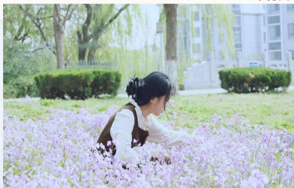
掬水月在手,弄花香满衣。 宿宣宣