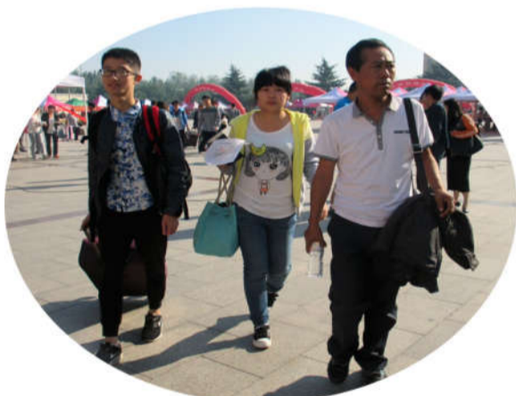
细心的学长在为学妹拉行李