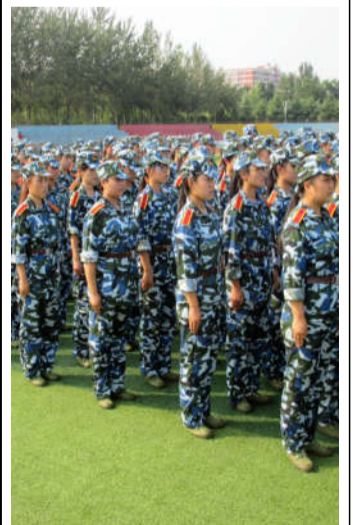
看!她们坚定的眼神