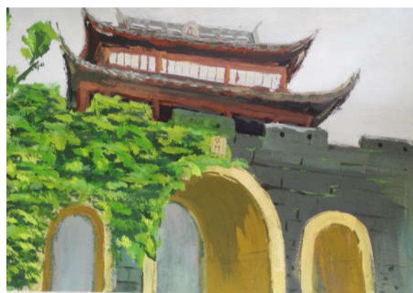
《苏州老城门》17视传 孙守坤